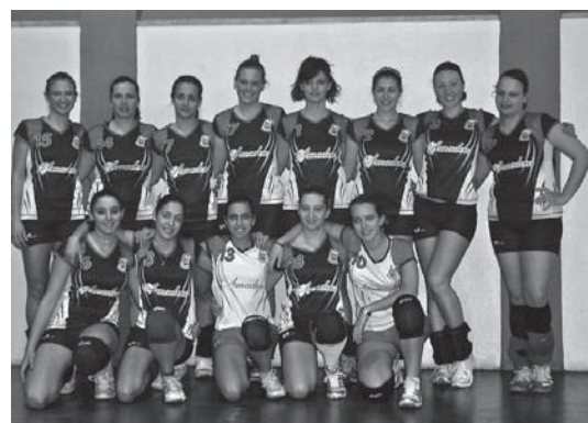
Nelle foto dall'alto: Gruppo mini volley, Gruppo super mini volley, Under 13-14, Under 16-17, Gruppo Prima Divisione Femminile.

SALUMERIA CORDONI LE MIGLIORI SPECIALITÀ IN SALUMI E FORMAGGI