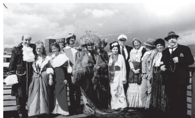
Nella foto i figuranti di Puccini in posa per il fotografo